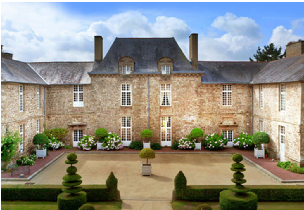
Château et Jardins classés "Monument Historique" – Jardins labels jardin remarquable et Qualité Tourisme