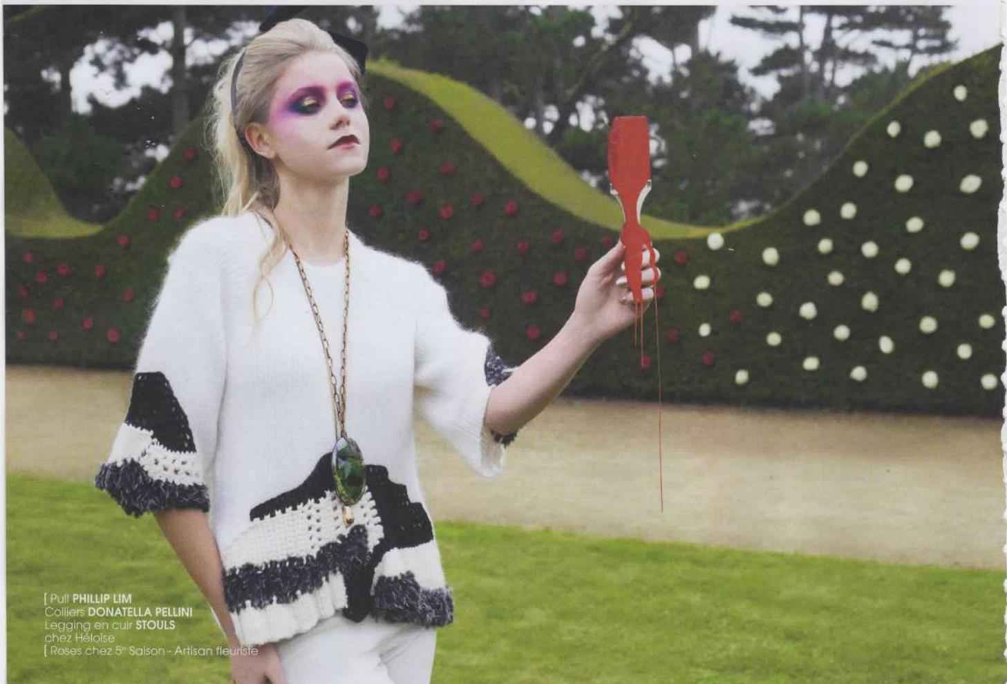
[ Pull PHILLIP LIM Colliers DONATELLA PELLINI Legging en cuir STOULS chez Héloïse [ Roses chez 5 e Saison - Artisan fleuriste