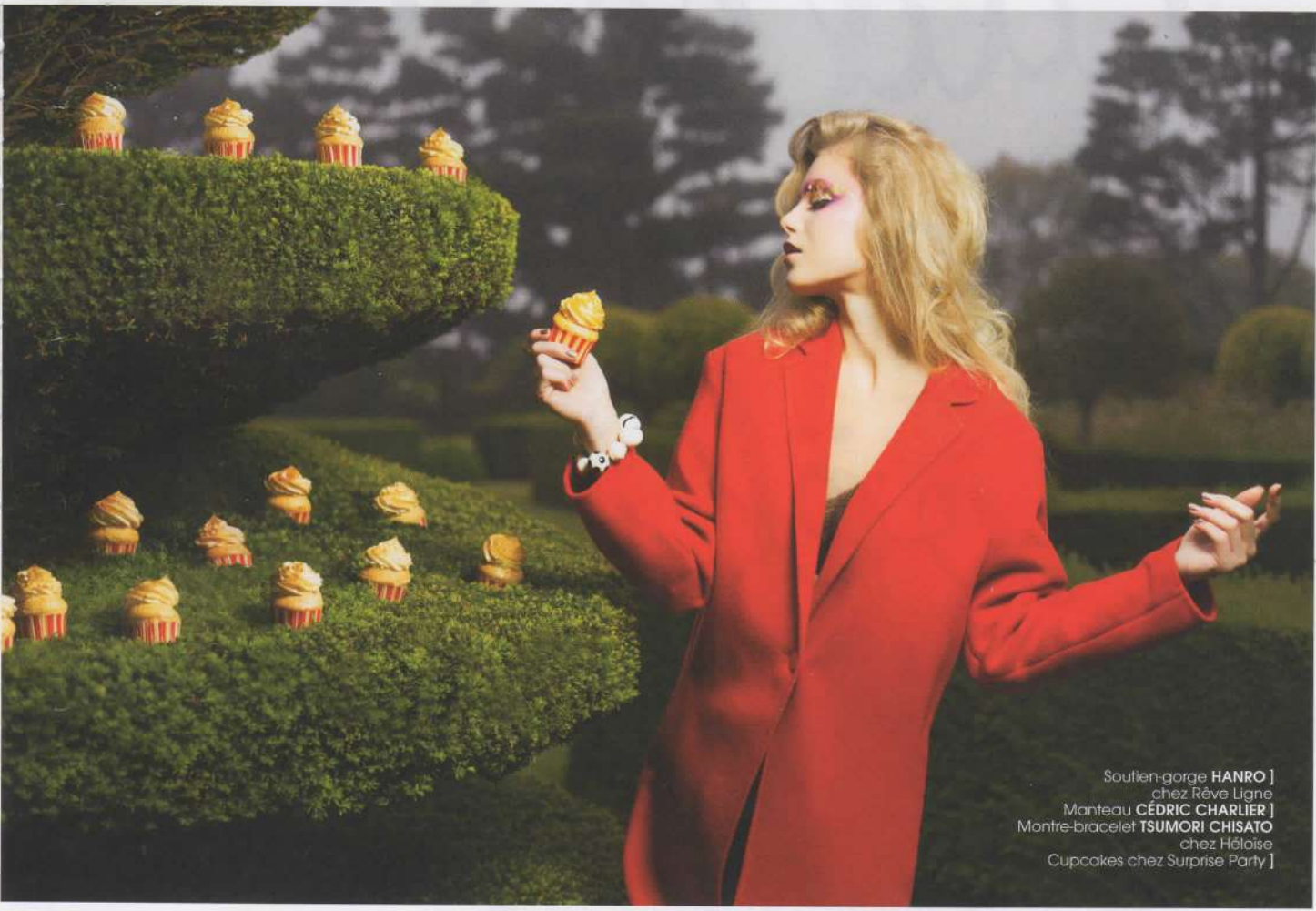
Soutien-gorge HANRO ] chez Rêve Ligne Manteau CÉDRIC CHARLIER ] Montre-bracelet TSUMORI CHISATO chez Héloïse Cupcakes chez Surprise Party ]

Il y a une certaine magie dans ce jeu de miroirs, de reflets et de résonances. C'est une danse subtile entre le réel et l'imaginaire, entre le visible et l'invisible. Elle se joue dans les courbes de la lumière, dans les ombres portées, dans les silhouettes qui se dessinent et se dissolvent à l'instar des vagues de la mer. C'est une invitation à regarder plus loin, à chercher ce qui se cache derrière les apparences, à explorer les territoires secrets de l'âme et de l'esprit. Car au final, c'est dans ces espaces liminaux que se trouvent les véritables trésors, les pépites qui nous redonnent le goût de la vie et le sens de notre existence.