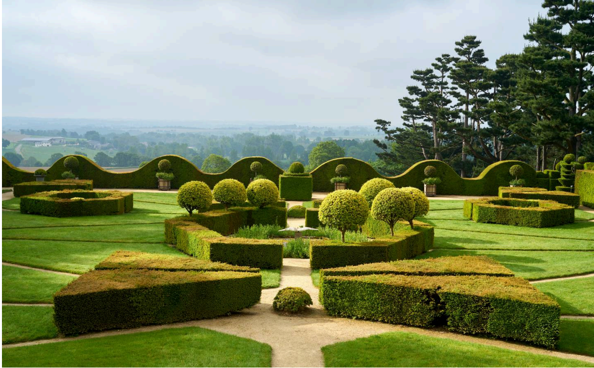
the garden in front of the La ballue castle Bazouges la pérouse, france, may 21,2019

Le jardin de la Ballue est un véritable labyrinthe avec des buis aux formes géométriques et des chemins tracés en diagonales. C'est en 1977 que le château éponyme a été classé monument historique avant que ce label ne soit étendu, en 1999, au jardin qu'il surplombe. Ce coin de verdure fait également partie des «jardins remarquables» de France (une distinction décernée par le ministère de la Culture et renouvelée tous les cinq ans).