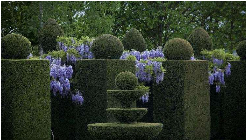
Les imposantes colonnes d'ifs de l'allée des dlycines, impeccablement entretenues, atteignent quatre mètres de hauteur.