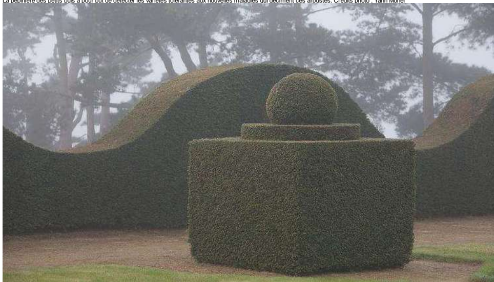
Les proportions parfaites des topiaires du jardin sont le fruit non seulement de leurs concepteurs mais aussi du travail passionné des maîtres des lieux et de leurs vaillants jardiniers.