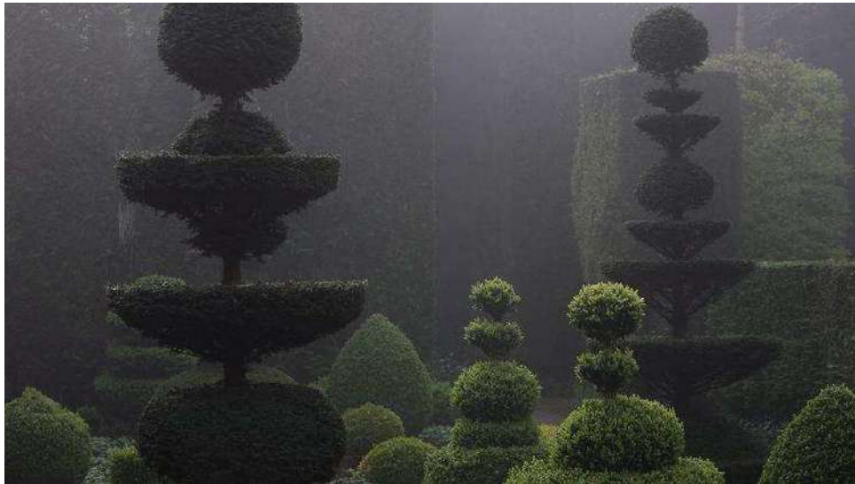
Dans la partie du jardin d'inspiration baroque, le «jardin mouvementé» est habité par des topiaires de buis et d'ifs.