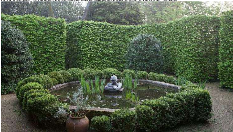
Le bosquet des senteurs est une chambre de verdure cernée d'une haie de charmes avec un bassin central dédié aux plantes odorantes.