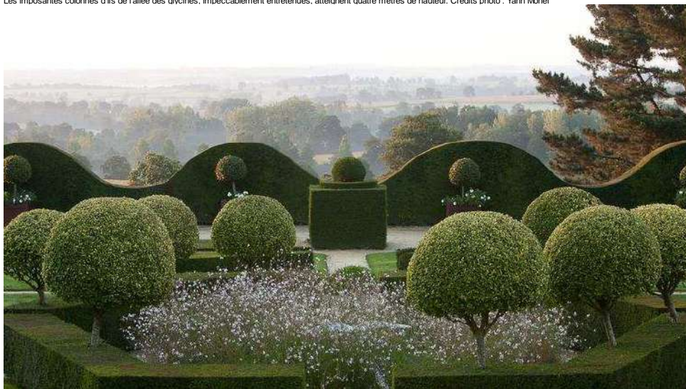
Au centre du jardin dit «régulier», ifs et troènes dorés sur tige encerclent une fontaine avec une sculpture en marbre de Carrare.