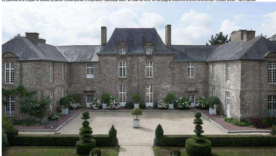
La façade en granit de la bâtisse du XVI ème siècle, classée Monument historique.