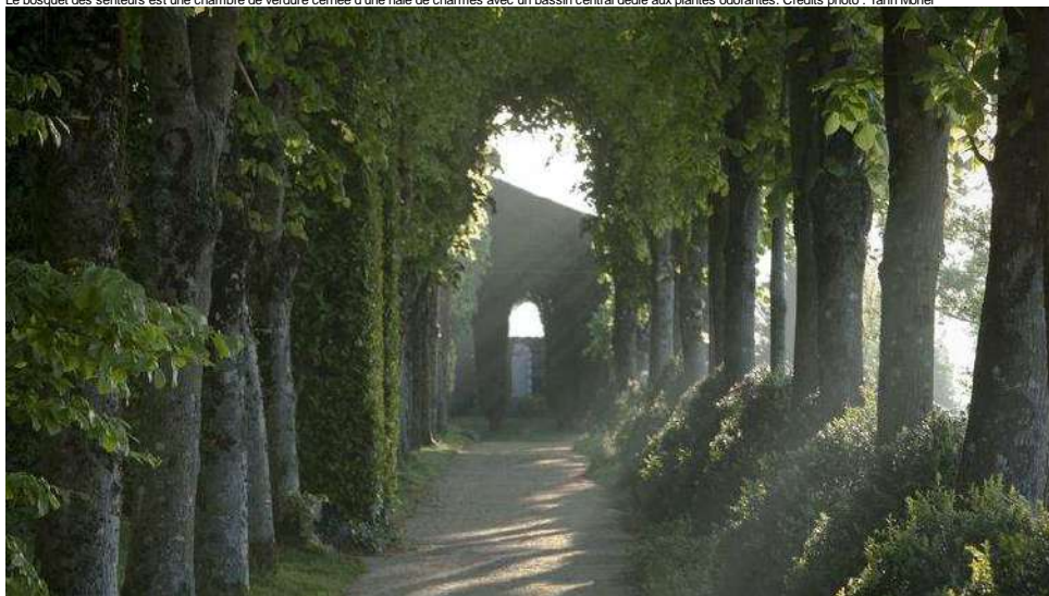
L'allée des tilleuls taillés en marquise, bordée de cônes de buis, appelle à la promenade et à la détente.