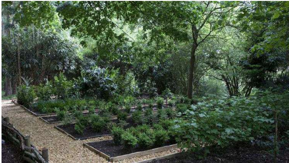
La pépinière des petits buis a pour but de détecter les variétés tolérantes aux nouvelles maladies qui déciment ces arbustes.