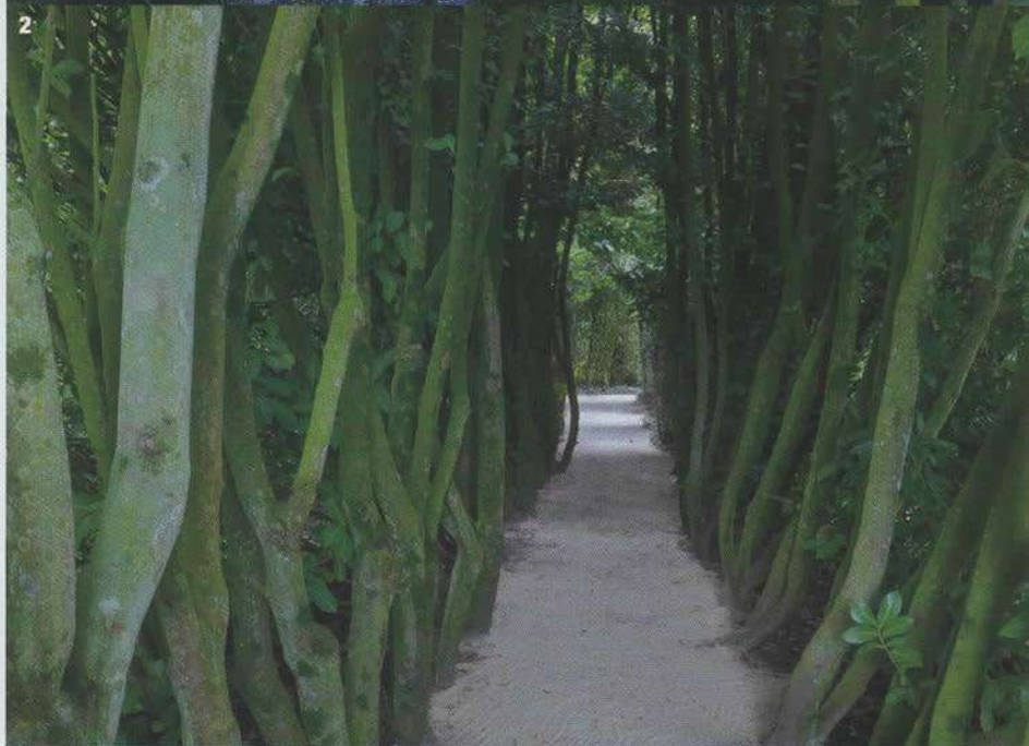
(1) Double colonne d'ifs taillés et alignés sur cinquante mètres, enlacement en guirlande de vingt-deux pieds de glycine. (2) L'entrelacs des troncs de Laurier Palme participe au mystère que

ressent chaque promeneur au cœur de ce tunnel, rarissime dans l'art des jardins. (3) Détail d'une topiaire sur fond de vague végétale.